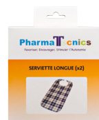
Motif non contractuel